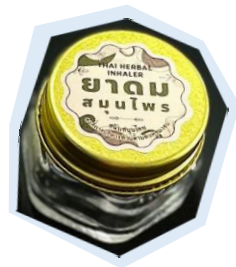
ยาดมสมุนไพร