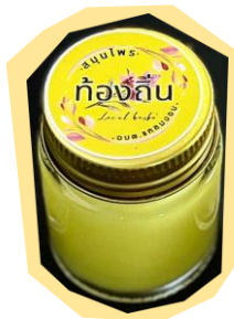
ยาหม่องไพร