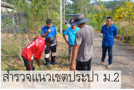
สำรวจแนวเขตประปา ม.2