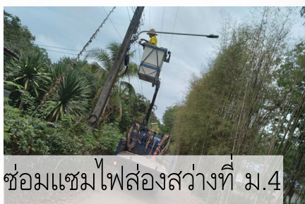
ซ่อมแซมไฟส่องสว่างที่ ม.4