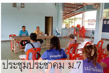
ประชุมประชาคม ม.7

ในเดือนมีนาคม 2567 เจ้าหน้าที่กองสาธารณสุขฯ อบต.แหลมวงษ์ เข้าร่วมการประชุมประชาคมหมู่บ้าน หมู่ที่ 5 หมู่ 6 และหมู่ 7 เพื่อชี้แจงทำความเข้าใจเรื่องการทำธนาคารขยะของหมู่บ้านซึ่งเป็นการส่งเสริมการคัดแยกขยะที่สามารถนำไปขายได้ เช่น ขวดพลาสติก ขวดแก้ว เศษโลหะ เป็นต้น ก่อนรวบรวมและนำไปขาย สร้างรายได้ให้แก่ชุมชน