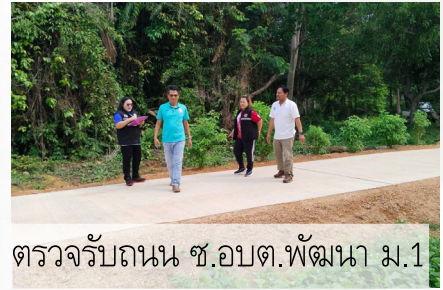
ตรวจรับถนน ซ.อบต.พัฒนา ม.1

นอกจากนี้ ในเดือน มี.ค. 2567 เจ้าหน้าที่กองช่างยังได้ร่วมลงพื้นที่ดูแลและชี้จุดติดตั้งการ์ดเลนที่ทางแยกบริเวณซุ้มทางเข้าอนุสรณ์สถานยุทธนาวีที่เกาะช้าง ดำเนินการโดยแขวงการทางตราด และยังได้ร่วมกับเจ้าหน้าที่ป้องกันฯ ตรวจสอบสัญญาณไฟกระพริบบริเวณปากทางเข้าหมู่บ้าน ม.3 และ ม.4 พบแบตเตอรี่ชำรุด และได้เห็นการเปลี่ยนใหม่เรียบร้อยแล้ว