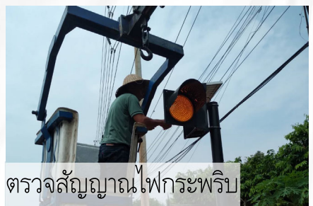
ตรวจสอบสัญญาณไฟกระพริบ