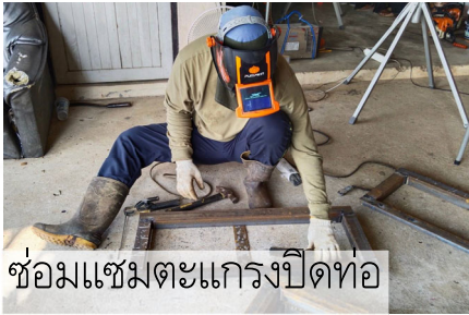
ซ่อมแซมตะแกรงปิดท่อ