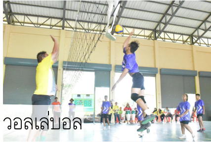
วอลเลย์บอล