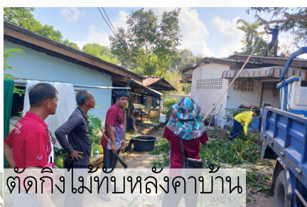
ตัดกิ่งไม้ทับหลังคาบ้าน

นอกจากนี้ เจ้าหน้าที่งานป้องกันฯ ร่วมกับกองช่าง ดำเนินการตัดกิ่งไม้ทับสายไฟและทับหลังคาบ้าน ตามที่ได้รับแจ้งจากชาวบ้านในพื้นที่ เพื่อป้องกันและบรรเทาเหตุ สาธารณภัย และยังได้ดำเนินการติดตั้งกระฉากโค้งบริเวณ ทางร่วมทางแยกที่มีความเสี่ยงอาจเกิดอุบัติเหตุทางท้องถนน