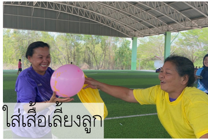
ใส่เสื้อเลี้ยงลูก