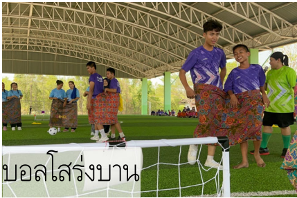
บอลลีสร้างบาน