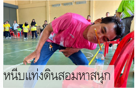
หนีบแท่งดินสอมหาสนุก