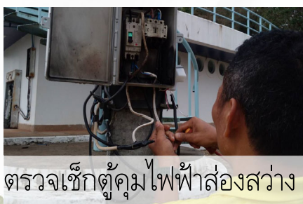
ตรวจเช็คตู้คุมไฟส่องสว่าง

ในเดือนมีนาคม 2567 นายช่างไฟฟ้าพร้อมทีมงานกองช่าง อบต.แหลมวงอบ ได้ดำเนินการซ่อมแซมไฟส่องสว่างที่ชำรุดตามที่ได้รับแจ้งและที่ตรวจพบ รวม 11 จุด และตรวจเช็คตู้คุมไฟส่องสว่างที่อนุสรณ์สถานยุทธนาวีที่เกาะช้าง ม.1 ตรวจเช็คระบบไฟส่องสว่างริมถนนสายหาดทรายดำ ม.6 และตรวจเช็คสะพานไฟ LED ม.3 ที่ขัดข้อง และดำเนินการแก้ไขเรียบร้อยแล้ว นอกจากนี้ ยังได้ร่วมกับเจ้าหน้าที่ป้องกันฯ ลงพื้นที่ตัดกิ่งไม้ทับสายไฟ ซึ่งอาจก่อให้เกิดเหตุสาธารณภัยไฟช็อต ไฟไหม้ ตามที่ได้รับแจ้งจากชาวบ้านในพื้นที่ ม.1 และ ม.2 ต.แหลมวงอบ