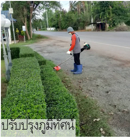
ปรับปรุงภูมิทัศน์

▶ ในเดือนมีนาคม 2567 เจ้าหน้าที่กองช่างพร้อมทีมงาน ได้ออกสำรวจแนวเขตประปาที่ ช.รวมใจ ม.1 และ ช.สุนทรานิล ม.2