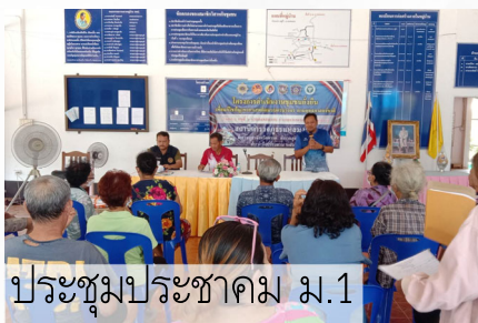
ประชุมประชาคม ม.1